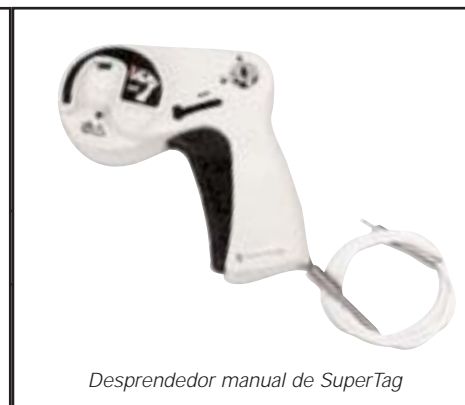
Desprendedor manual de SuperTag