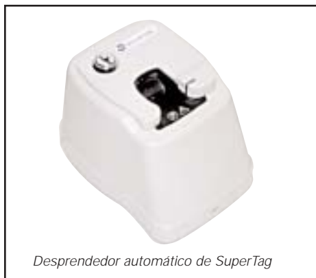
Desprendedor automático de SuperTag